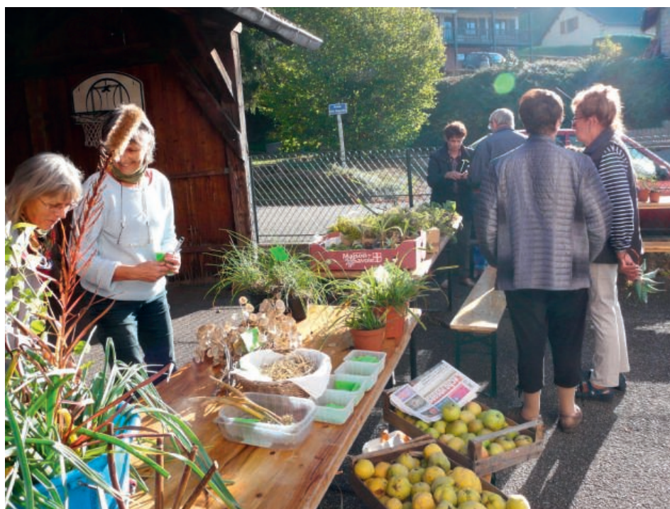
Le 11 avril, venez échanger vos plantes dans la cour de l'école de Saint Prayel.